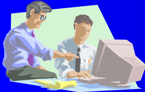
ArchCAD 7 (Graphisoft Japan)