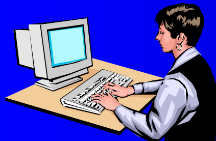
Ncad Arc (NEC) ARCHITREND21 (福井コンピューター)