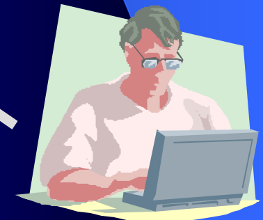
工事概要